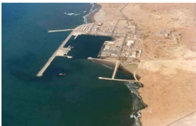
Port de Tan-tan

Depuis 1982, date de la mise en service du 16 port moderne d'El Ouatia, cette activité a connu un grand essor. Ce port, considéré comme le plus important du Sud marocain et destiné au renforcement du système d'exploitation des ressources halieutiques des côtes méridionales, a fortement influencé la structure de l'économie locale et régionale.