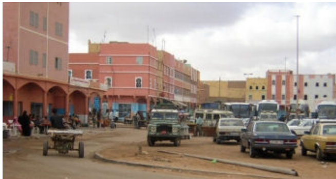
Station de voyage avant son aménagement à Tan-tan