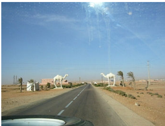
Nouvelle entrée de Tan-tan

Publié par internaute67 dans Galerie D'Images Et Photos