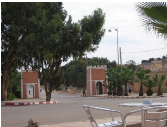
Endroit qui relie les deux rives de l'Oued Ben Khilil