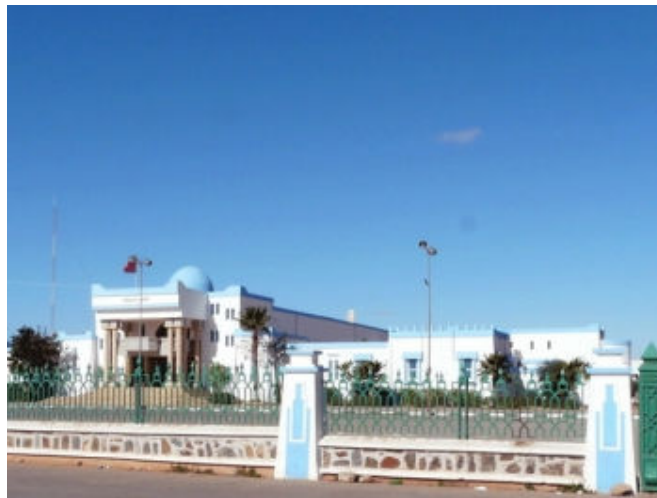
La municipalité de Tan-tan