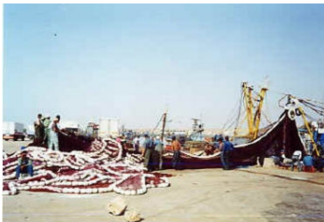
Activité de pêche à Tan-tan plage

Toutefois, il est à signaler que l'activité de la pêche reste irrégulière, pour ne pas dire précaire, pour plusieurs raisons dont les plus importantes sont la nature saisonnière de l'activité elle-même, l'ensablement fréquent des bassins du port et l'instauration de périodes de repos biologique de plus en plus longues pour permettre au stock halieutique surexploité de se renouveler. Les débarquements ont atteint 293 000 tonnes en 1995, mais ils n'ont pas dépassé 80 000 tonnes en 1998.