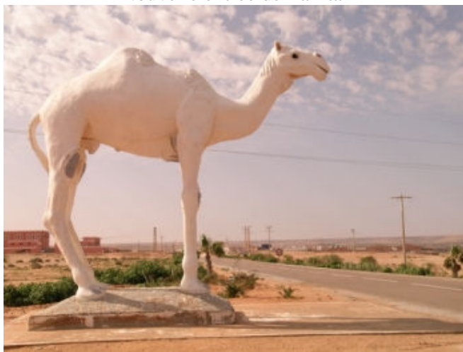
Dromadaire à l'entrée de Tan-tan