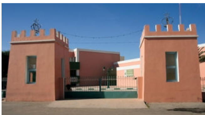
Porte d'entrée de la prefecture de Tan-tan