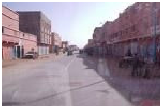
Boulevard à Tan-tan