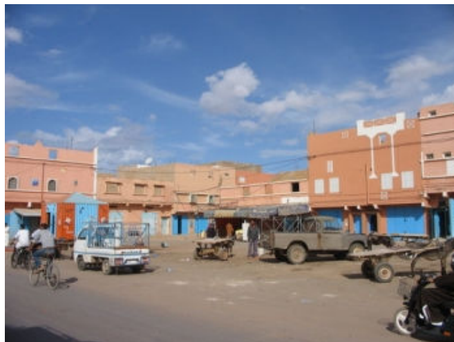
Quartier près de la station de voyage