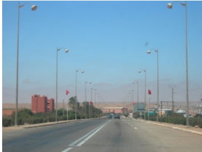
Entrée de la ville de Tan-tan, Hay El-Massira