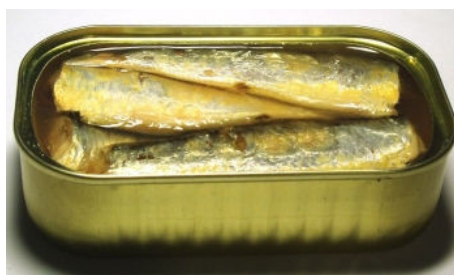
La mise en boîte de conserve est l'importante industrie à Tan-tan

L'apparition de ce secteur est liée au port. Depuis la mise en service de ce dernier, trois quartiers industriels ont vu le jour. Ils sont principalement spécialisés dans la congélation, la conserverie, la production de farine de poisson et la fabrication de glace. Le nombre d'unités installées est de l'ordre de 16 établissements employant environ 4 000 personnes et génèrent près de 220 millions de dirhams de recettes (Plan d'aménagement). Cette activité est marquée par la périodicité de l'animation du port.