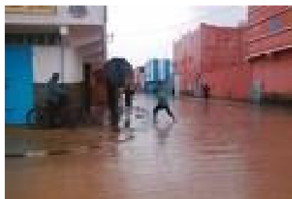
Tan-tan, les pieds dans l'eau